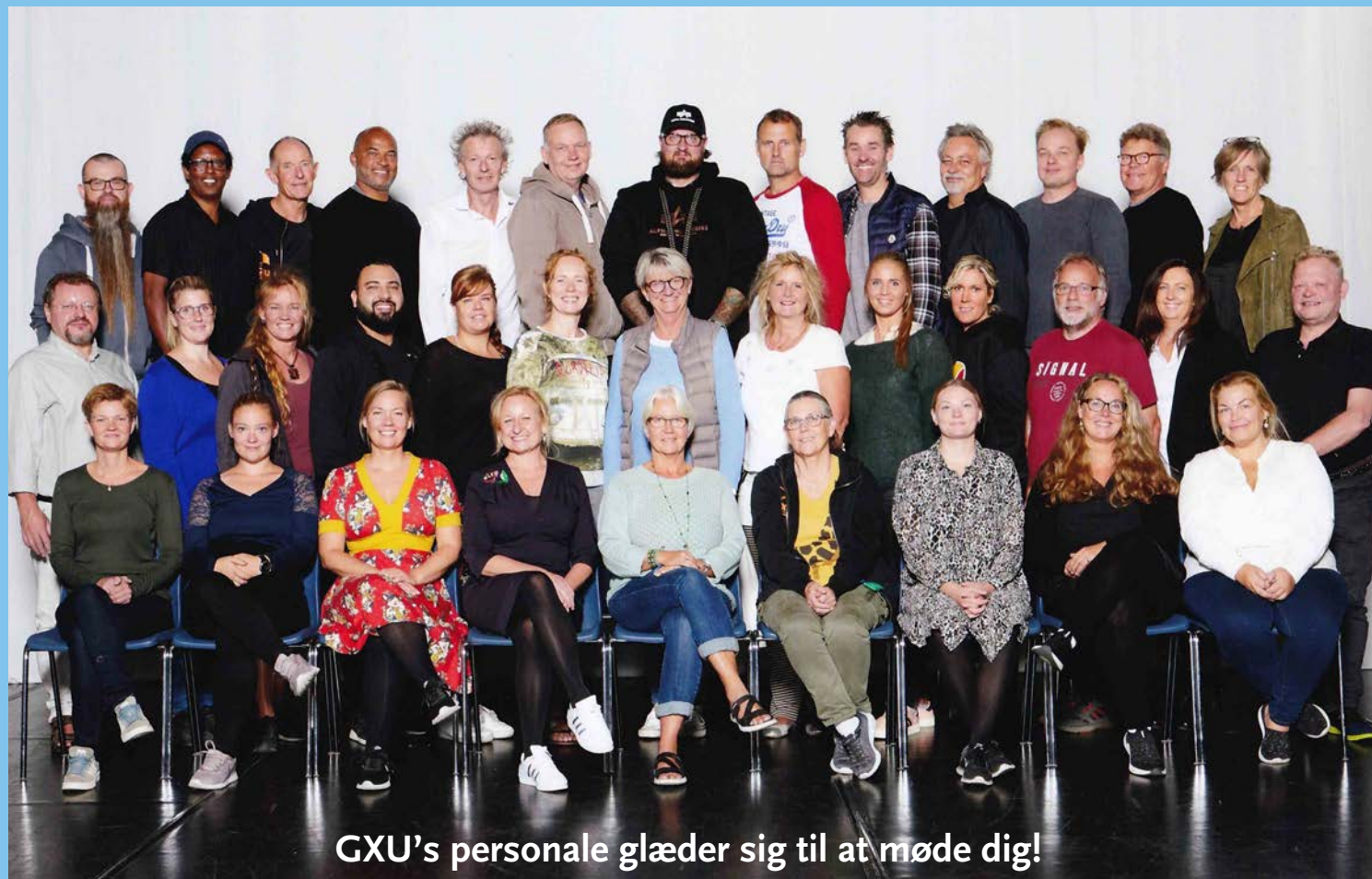
GXU's personale glæder sig til at møde dig!